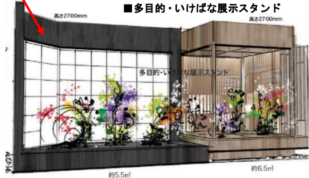
■多目的・いけばな展示スタンド